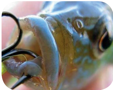
La « pesca sportiva »: un vero orrore per le vittime.