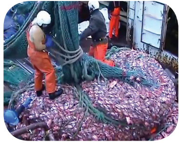
La pesca a strascico: un massacro senza precedenti, delle morti terribili.