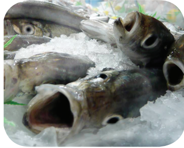
A volte agonizzano per lunghe ore sul ghiaccio nei pescherecci.