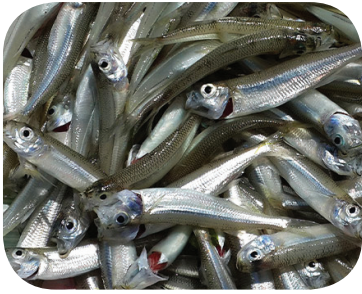
Uccidiamo miliardi di pesci ed altri animali acquatici.