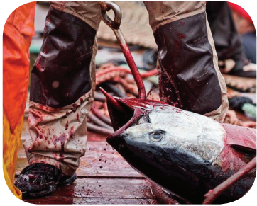
Le peggiori crudeltà sono legali e banali quando si tratta di pesci.