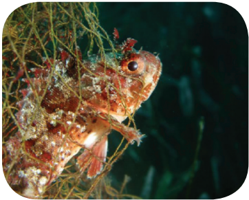
Le reti alla deriva continuano ad uccidere i pesci per anni e anni.