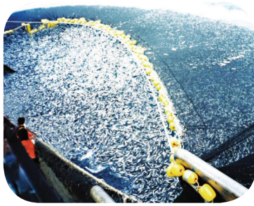
La pesca con reti a circuizione, una razzia omicida.