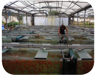
Anche per il mercato dell' acquariofilia gli allevamenti sono intensivi.