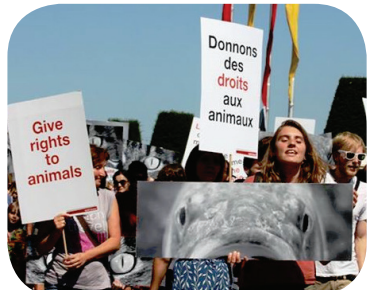
Manifestiamo per dare diritti ai pesci!