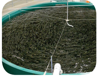
Alcuni allevamenti intensivi: delle cisterne.