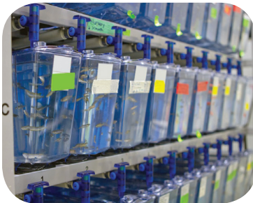
I pesci sono anche tra le principali vittime della vivisezione.